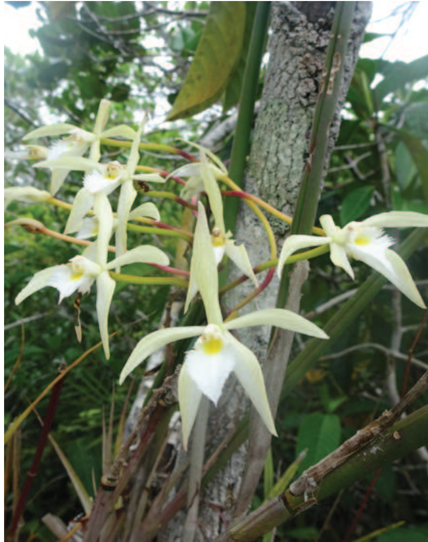
Figura 18. Nhaaha liiwi nalhioka neekhe tsoixipetsa nheette nakanakaita keeripa nattaitakaro kathiwikana.

natawiñakawa horeweriko nhaaha hiako. Aaha RDS-RN apadawa keeripa, Cantharellus sp , pakoakaperitsa naapidza nhaaha cantarelos aaperi Europa, pakeetaka nhaa hamaliani riko, pakeetakana lipokoda nako haiko Aldina heterophylla , wanheeri kadzolheeaha halapokolina oo mookoli ka hamalianine. Lhiana limottoita hore nhaaha keeripa paiñhanhi hoiperi tsoophaipe tsa koakadaa ipedzoli keeripa.