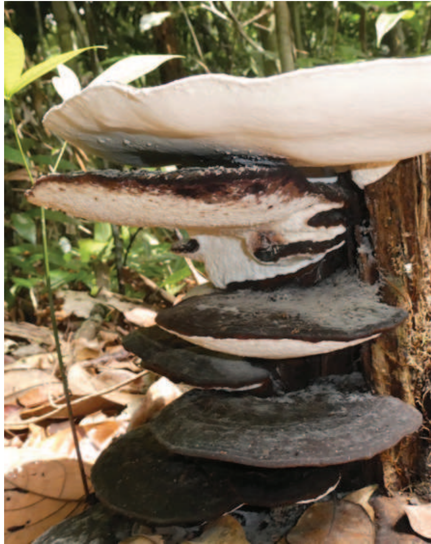
Figura 12. Nhaaha iwadzakeetakape amottoni nakadaa matsia likapakanaa awakadaapi, naatsakhaa haikonai iinawa matsia nakadaa pemanhikaawa.

littapa nalhiwawa, hirapittinaa phatsa papiñeetaka kadzo. Kanakai tsakha papiñeetaka nanako nhaaha apaanaapha tsakha awakadeetta: keeripa. Apada ittathakadaa: “koaka lhiehe hanipadali phaa awakada liko?”, hirapittinaa watsa pikaiteka nhakani nhaaha liwittale kaawhiperi keeripa. Kadzoaha, apadatsa linakhitte lhiehe liwittale kawhiperi ikatsa nhaaka keeripa naha wapakali, nanakhittetsa waiñha oo kawhainaali wapakaka poalipe kaiperina. Kadzokhette, manope nanakhitte nhaaha liwittale kaawhiperi linhoini linakhitte nhaatope bittimeperi lipikhaa panheekani limale. Manope naha liwittale kawhiperi nainaiwaaka aaha awakada liko hirapittinaaperi