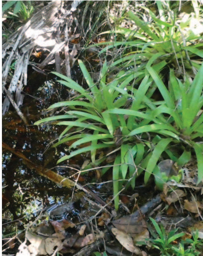
Figura 9. Apawapenaa hamaliani riko neeni ooni liekoaya likotsa, ñame tsakha pakapa hore panaphe hipai riko nheette kadzo pakapani kalittaaphipe dzo.

manakhepi nheette piipiripi, metsa, awakada liko wakeeta haikopali hanipaperi oo makadalipe keheetsa namottokeetsa hipai rikhitte, pakapa kapidzo nhaaha manakhepipe dzoperi iiraiperi iphe.