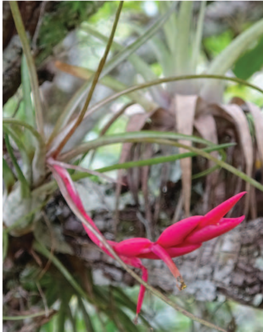
Figura 19. Dzoowatedape dzoperi nalhioka nakadaakaroda ooni nadaki riko nheette ikametsa nameetakani deepi

nhaaha koakadawaka neemaka halhaame, nakitsindataakakawa apadawa iapidza. Kadzokhette, wanheekaa naapidza naha newikinai nakaite neeni minikatsa watsa nhaaha yomakapeetsa apadawa idzaadza nadzaadawa nheette ñamekadaanatsa koaka naali likoada. Hipai riko kadzo tsakha. Nhaaha keeripa nakitsindata naha haiko, apanaa nhaana yomakapetsa iñhaka nainoakarotsa haiko. Kadzokhette, haiko nheette keeripa nalhio kopedakaa napidza waakana hanipadali nanheekaro koamedalika lhiena nakitsinda nheette nakoema. Lhiehe kakopedakaana linakhitte namadeka, kadzo wanhee kapidzo lhiehe wadaki linakhitte ikadaakada panhee. Panheeka yakaadali