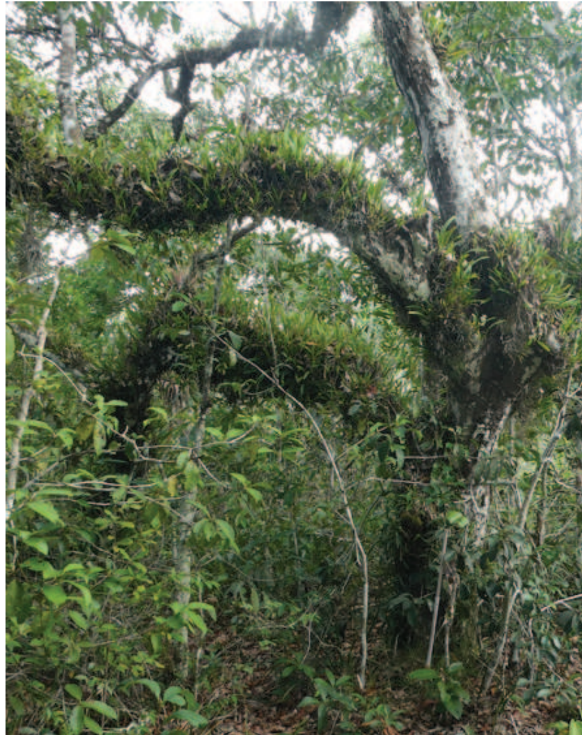
Figura 20. Nhaaha mookoli halapokoli rikoperi pakhameka nayoni nhaaha liiwi nheette dzoowatedape nheette apaanaaphaa irokape linako.

tsome dzotsa. Keeripa nheette haiko kaakopeda nhaa linakhitte neettani oo naanaa yarokadawa nheranida ooni rikhitte. Lhiada poadzadalitsa ikapakanaa lirhioka likapakanaa pakoaka liapidza pirhio kapidzo senha phitaxoopala palaata aanaha banco liko. Matshi kadaatsa piroitaka ñame watsa likadaaka phiewawa.