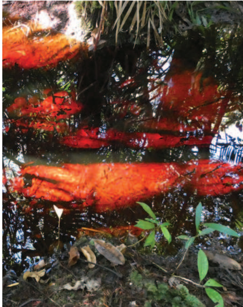
Figura 2. Nhaaha ooni Iñawapoitta nalhioka nakapakanaa iittaanhai iiraidali lima Ihiehe liwakadatenaa, metsa mapittanhaikatsani.

tsakha, metsa ikatsa likapakanaaka neerhe. Nakeñoali naamaka nakapa nhaa yookakape ooni ikapakanaa iittakani, nhaaha yaatsakapeetsa iñawapo aaha deekaidali, Ihiena ooni matsiadali haaleanhai wadeetsa paawaadaka kaapittakani ñamedalidzo matsia papitaka neeni, metsa ñame hapeeka.