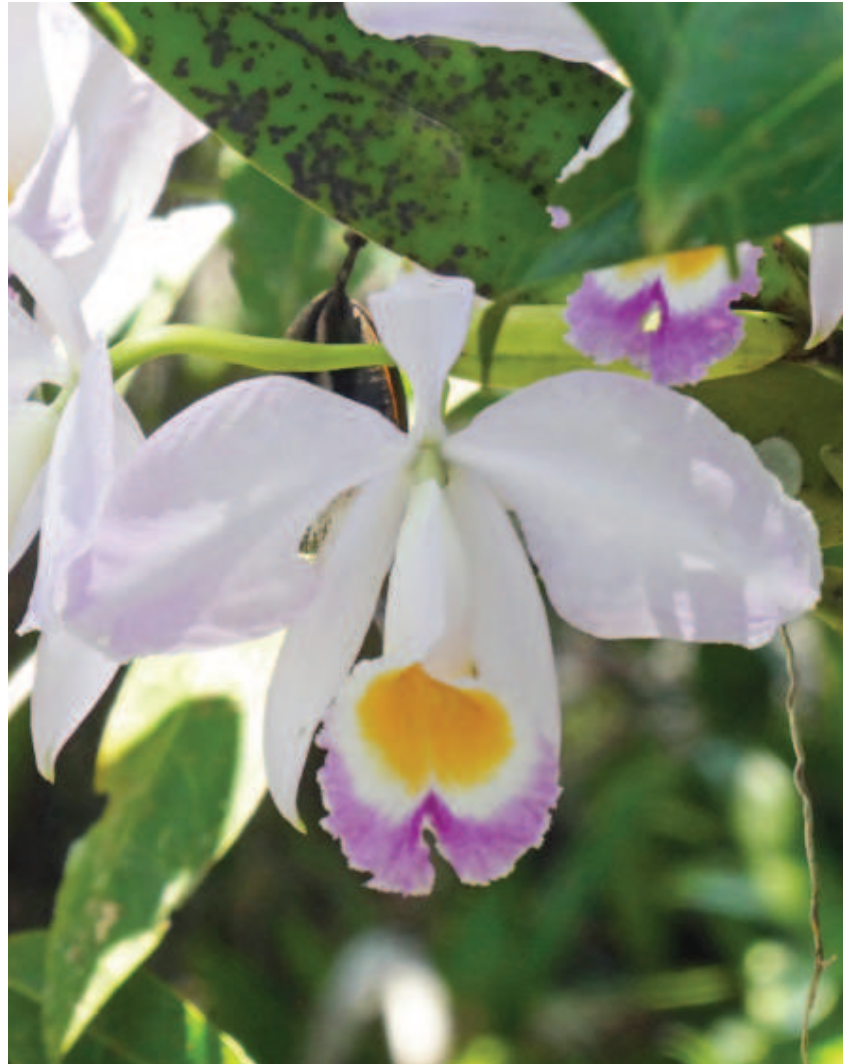
Figura 22. Liwi, likadzodzo Cattleya eldorado , ikatsa hoiperika nakapa nhaa yalanawi, metsa awakada imatsiataka horephaattoo kakoadaperi.

nako ñame mherapittinaaka katsa nalhio nhaaha haiko. Nhaaha liwinai nalhioka neekhe tsoodalipe tiki kawaale ittaitanipe ideeka dzenoorhe phaa haiko nako, kaddzo tsoixipe kapidzo nhaa liekhe ñame nalhioka natawiña karoda, ñame koameka nalhioka newhearo. Kadzokhette, ikametsa nalhioka neekhe namatsa nhaaha keeripa.