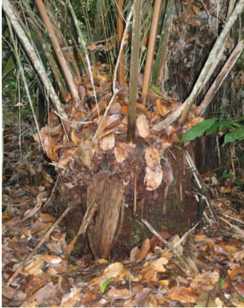
Figura 7. Nhaaha haiko makenaana peritsa, iirai peri iphe, nhepaka liphe hiwakape napali irhio nattaitakaro naiñhaka.

imaapittatakape ooni. Kadzokhette, pamatshikeeta kadaa nhaa iñawapo pawhieta hoore naawa nhaa kawhiperi kadzotsakhaa nhaadzo nhaa ipitakape neeni.