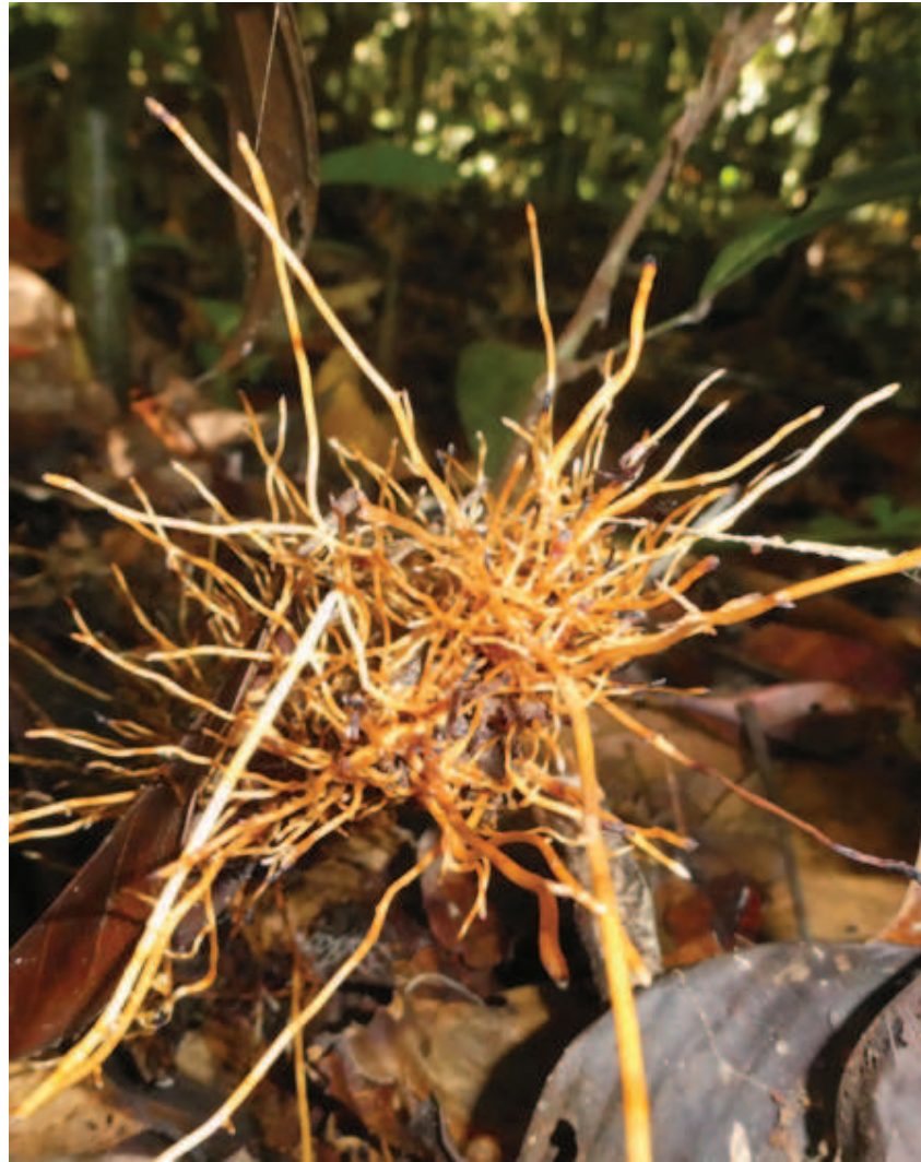
Figura 8. Apanapenaa haiko kapalikana heekoapirikolhe, lhidzaako iyo lhiehe hipai, panheekani kakodzairene.

nanakhitte watsa nhaaha apanapenaa haiko ikapakanaa nakhitte, metsa wakeeta watsa waanheeka ñameka nattaita nadeenhika nhaawaakatsa.