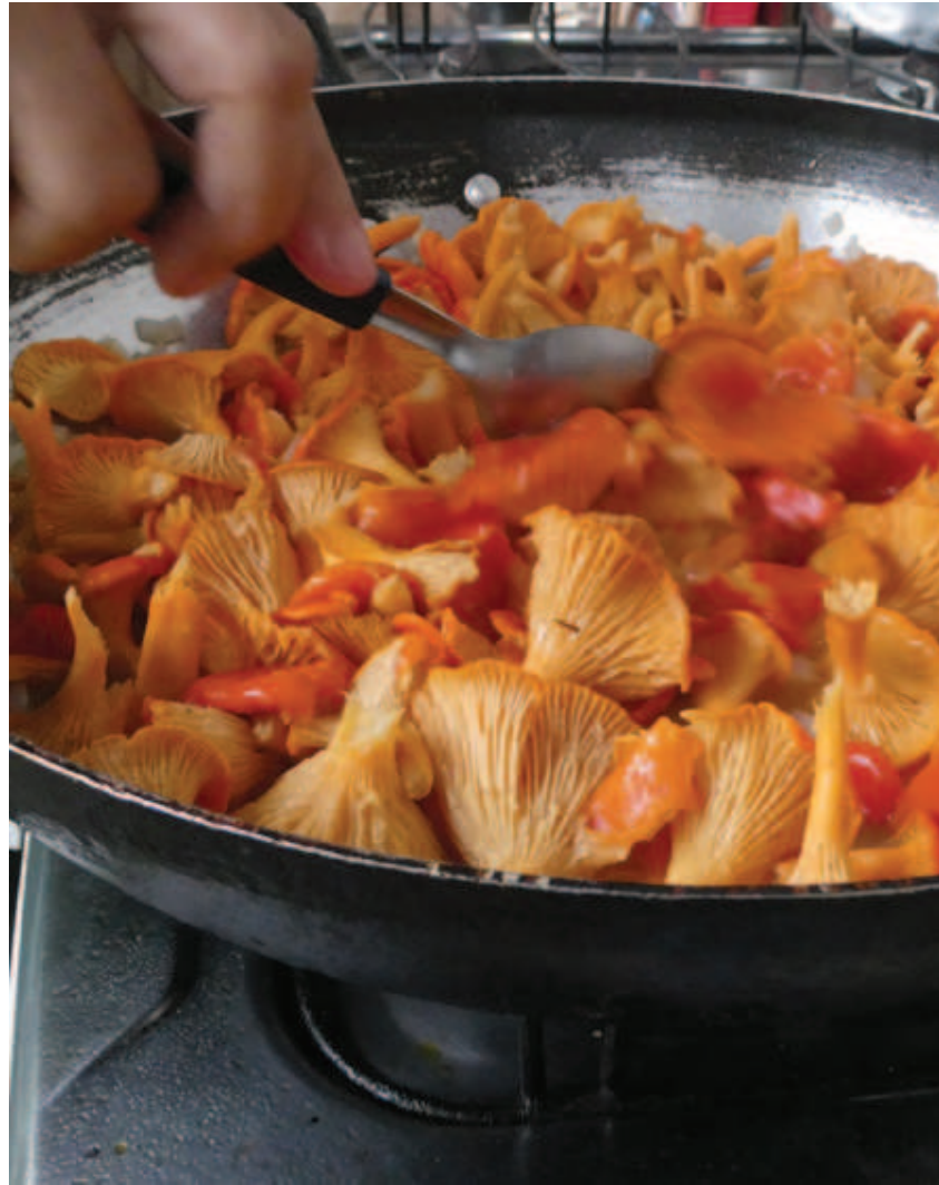
Figura 15. Nhaaha keeripa ewaitepe irokape mookoli nako pakoakaperi dzotsa cantarelos européios nheette pakoaka tsakha kettapakana.

Apadapenaa keeripanai neemaka nakitsindataakawa haiko iapidza, panheekani micorriza. Nhaaha paniattinai nakadaaka keeripanai irhio nhedzaakowa pottidzadali nheette phaa apanaa matsiaperi nhaaha keeripa napiiri napikaa yoma naiñhawada, likadzodzo fósforo nheette potássio, kanakaiperi paniatti irhio. Ikitsindatakhetti lhiena hirapittinaadali khaaka wakaiteka apada nako oo manopedali kawhidali nako. Manopewali, ñame haiko, ñame keeripa ittaita kawhika liema ñamekadaa pakapa phaa nhaa apaanaa.