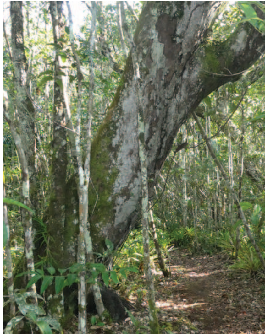
Figura 13. Mookoli makane littaita litawiñakawa kalhekatsa lioma negro linako nhaaha apanaa naikheette nhaa likitsienape

yemakada haiko iwawa liko, napadameetaka nheette namatsiataka inipo, nadeenhikaale ikadaali wattaikaro wanhika awakada liko. Ñamekadaa mitha pakapana, apadatsa mitha pandza wattaitali wamatsiataka iyo nhaaha haiko ike nheette panaphe ikametsa pandza mithani ttidzee, metsa kawhainaadalika nalhioni nhaaha haiko nhetto newiki.