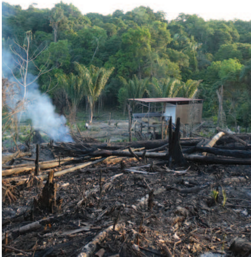
Figura 5. Nainoa kadanako lhiehe awakada nheette nadeenhikadanako nhaaha panttinai tsometsa iñawapo yoodza nawhietaka nhaaha liiñeninai nheette tsakhaa nhaa newikinai.

padeenhinida kadzo pakeeta pakapaka lhiehe opidalimi nadeenhinida napitakarodaka aaha Manaus liko.