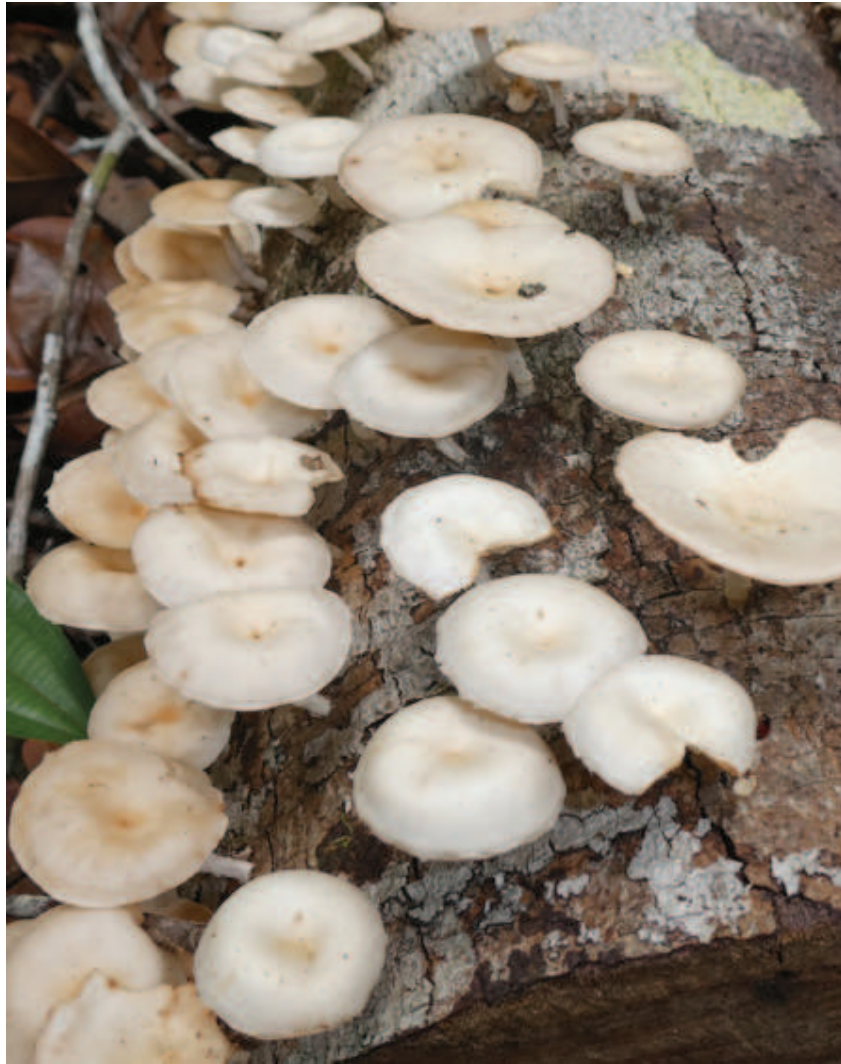
Figura 11. Nhaaha keeripa wakapali inokape nanakhitte nhaaha iwadzakeetakape haiko mathinaaperitsa tsikolee dzoperi.

awakadeetta akatsa natawiñawa neema liekoaya likotsa. Dzenoorhe kaawa hamaliani, hipai lhiena nadeenhinida phiome nhaaha haiko ipali nheette naphe ikodokapewa. Hipai ñamekawaphatsa matsia awakada ittaita imatsiataka likapakanaa! Pakeeta kadaa apana haiko hiwakana pattaita panheka ñameka matsia napali itawiñakawa thewaka mitha hipai riko.