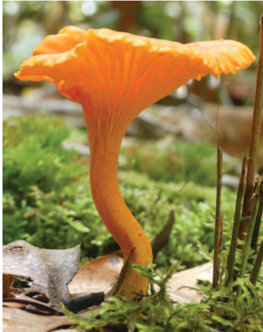
Figura 14. Lhiehe keeripa ewaite Cantharellus sp. Liemaka likitsinda naha haikonai, haikonai yaa hidzakotti nheette keeripa iñhawadatti.

Lhiehe tsoodalitsa yemakada napali riko ttamhiadalitsa nheette ñamedalitsa ittaita itawiñaka yapi. Hirapittinaa mitha apana haiko ideenhika lipali makane liemakaawa liko lipokodee natarawakawa liyotsa lhiehe liñhaxoopa, littaita kadaanatsa mitha lideenhika hidzakotti linakhitte lhiraaka likaalewa liphe iyo. Lipoadzaka, napali nhaaha keeripanai nattaita napokotakawa kheedza hipai nakhitte, metsa natawiñaka likoatsa kanakai kapoa nalhio naiñhawada. Matsia mitha limottokawa nadeenhikadaa pakoaka nhaaha paniatti nheette keeripa, metsa kadzokani.