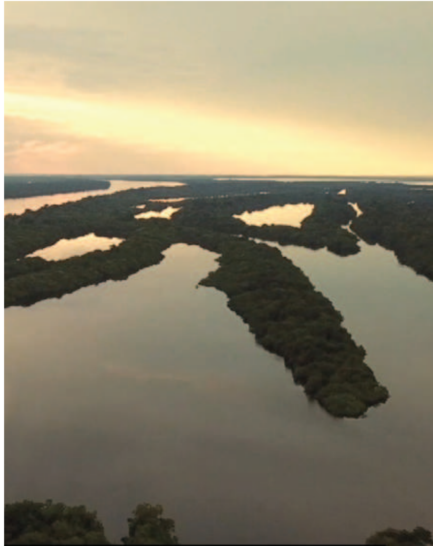
Figura 3. Nhaaha katonoli namottokawa lhidzaako iyo lhiehe makapawani liphianipe tsakhaa lhiehe apapeko ooni rio branco.

nhaaha awakadeetta naapakarowa napietatsenakhaa nawakeetaka walitteda matsiaperi nhaaha pakapali hipai riko, pakeetali pakapaka phiome hipai riko, mherapittinaaka peritsa ikodokawa. Matsiaperi minitsa itaimetakape nhaa paniattina ipali phiome nhaa ipakapewa matsiaperi padeenhika paniattinai ipokoda papana kadanako paniatti.