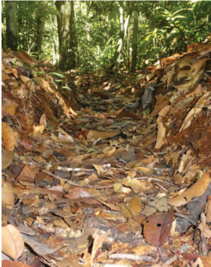
Figura 10. Nhaa newikinai yemanhikape inipo liko kathinaaka napowami hiipai nako, kathinaa pakapaka hipai haikopali imottoitanhi nheette matsiaperi nhaa.

Ihiehe haiko hiwakada lipokoda nako. Kadzo tsakha, nattaita nakeetaka Ihiehe kanakaidali nalhio, metsa kanheekheka nadeenhika nattaitakaro nadantaka Ihiehe naiñhawape wadeekatsa kaida idawakani thewaka nheette kametsa lipañakawa.