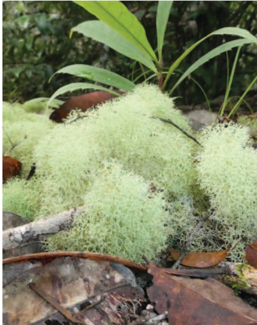
Figura 21. Phaaroda Cladonia sp. Halapokoliitta ñame kanakaika nalhio apanaa haiko ikitsindatakawana nheette pakoaka likapakanaa esponja limottoka hipai rikhitte.

natawiñaka hipai rikhitte, metsa nheettephaa watsa wakaitepe linako.