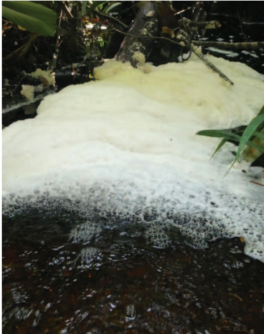
Figura 4. Liikali haaledali limottokawa aaha iñawaponai iittaanhai yodza, metsa lhiena ooni mapittanhaitsa, likali Ñame tsakhaa limatsikeetaka.

ooni ittapeko likotsho yopittatti padaki yodza khedza, nheette tsootsa panaphe ittii awakada likoperi ideenhi likali ooni yekhoette.