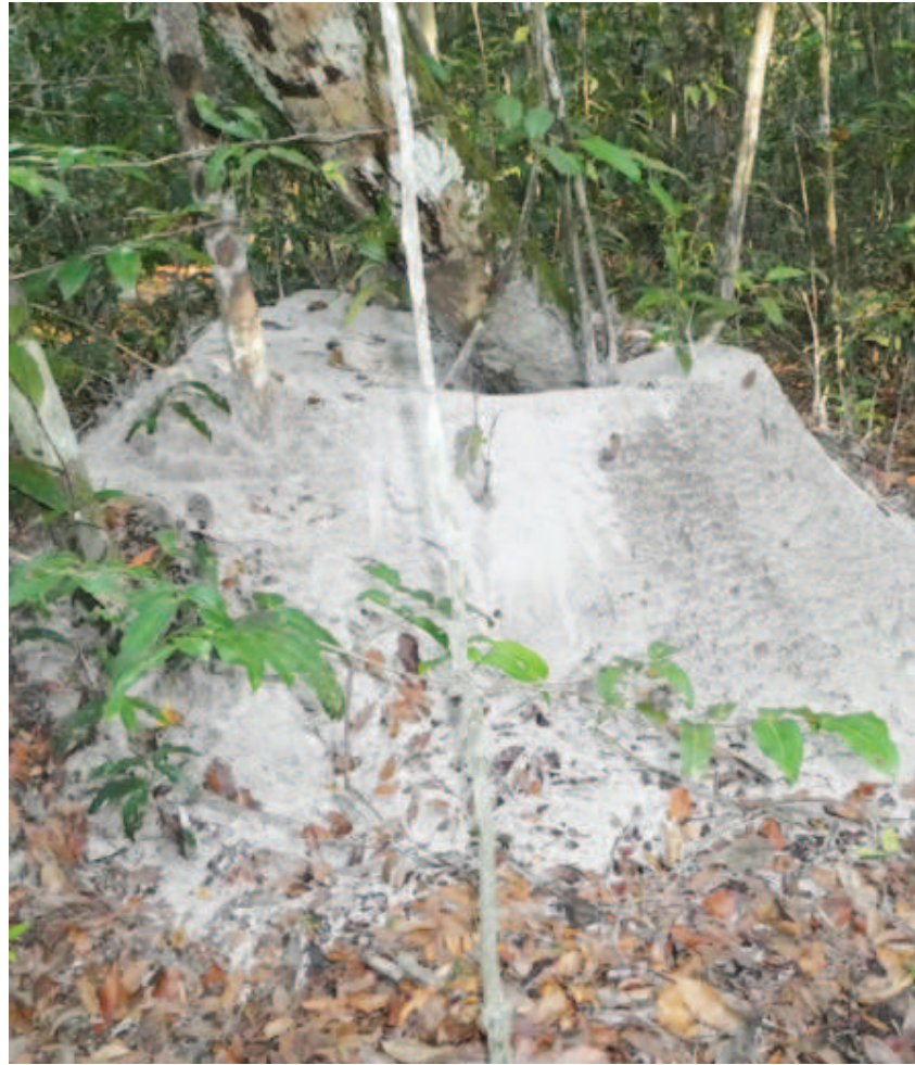
Figura 1. Hore hipai kaida haaleperi lihanipaka makapawani wadeepe lhiawaka minikatsa, kadzo wakapa kapidzo koowhepeda nako.

ikatsa watsa likaitepekanaaka lhiehe livro, metsa wakeñoakaro wakaite napidzawaaka lhiehe hipai liapidza ooni ima ikatsa kaawhikalika nalhioni nhaaha paniattinai nheette nalhio tsakhaa nhaa newikinai yemakape neeni.