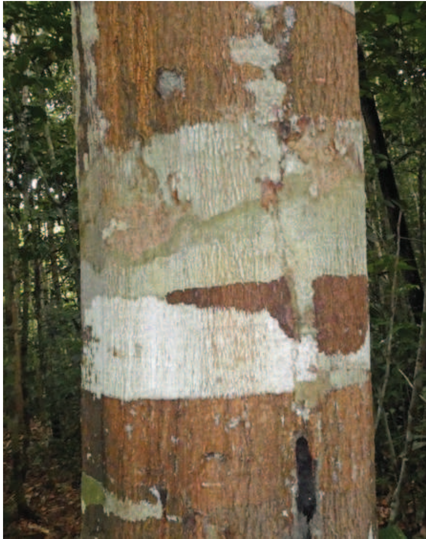
Figura 17. Nhaaha phaaroda nayoperini nhaaha fungos, bactérias, algas dheette leveduras, tsooperitsa dheette nerokawa haiko ikenaana nako dheette panaphe nako.

Napidzawaaka nhaaha awakadeetta hanipadali ima neenika hore phaattoo nhaaha haikonai dheette nhaaha keeripanai, kanakai ikadzekataakakape nanako nanheekaro koameka neemakawa liko aaha hapidali kaawhiperi yodzawaaka hipai nako, kadzo lhiadzo Amazônia.