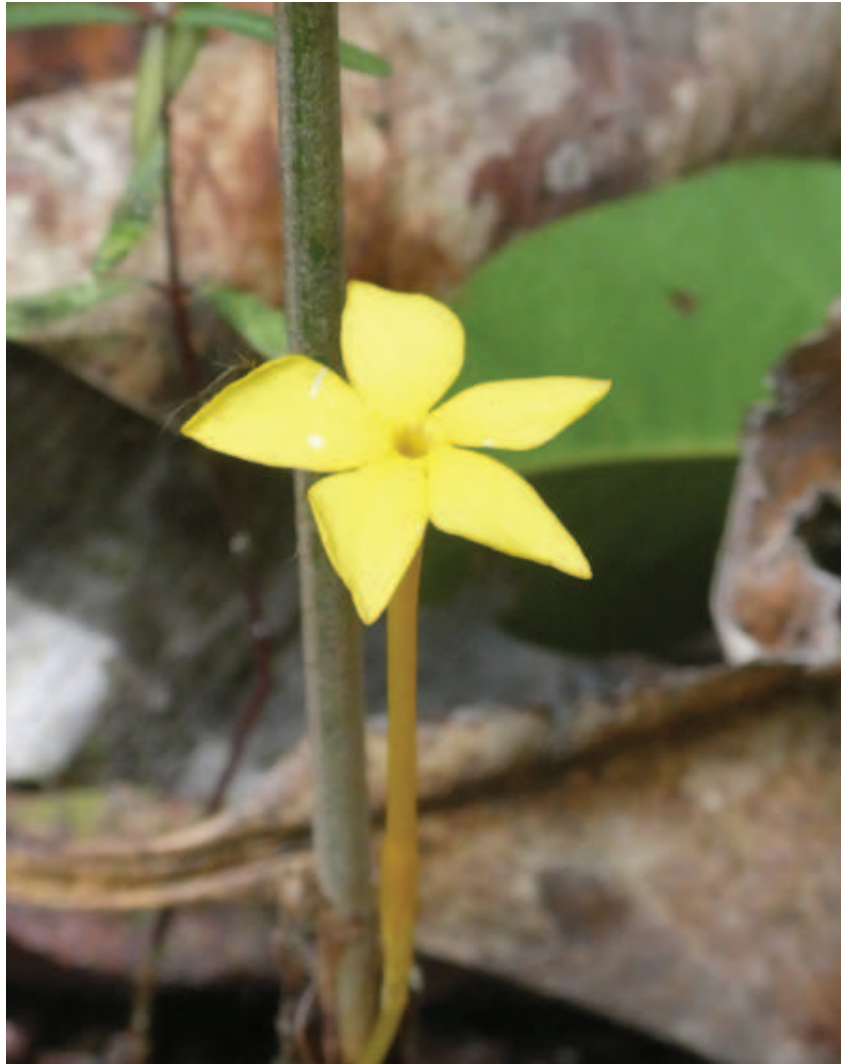
Figura 16. Lhiana paniattika maphenetsa apawalipe panheekani saprófitas, metsa nhaa kaiwi peri nalhio nhaa apanaa nheette nalhio nhaa lidalhipaperi.

ima nattaitaka nawakeetaka hore apadeeniritsa nhaa haiko lhiadanakotsa. Aaha Europa, nhaaha iomakape ianheeka nanako nakadzekataaka linako haiko iyaita dzodali ikapakanaa hiipai rikodali, metsa haiko thewaka maliomene mitsa ikodo kadeetsa. Lhia noadeena kadzoli haiko natakhanina noada oopi, kameetsa neenirika lipokodami, ñame koaka ittaitali ianheeka koadaka kaawhitsa lhiehe haiko iyaita ñame kadaana pakapa liphe. Wakeeta wanheeka pikaromi katsa neroakaka apana haiko iapidza keeripa nakhitte napikhaa nakhitte. Nhaaha apanaa haiko natarawatani ñamekadaaneetsa littaita lhiraaka likaalewa.