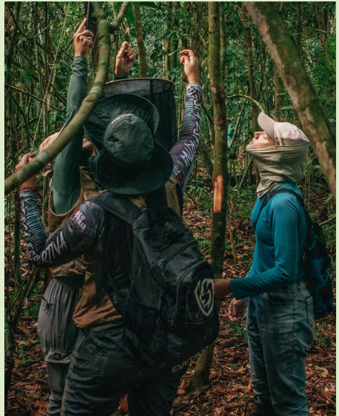
As equipes de campo realizam atividades ao longo de todo o ano, desde a coleta de dados em campo, processamento, análises e publicações de artigos científicos e livros, tornando o conhecimento da Amazônia do Mato Grosso aberto.

Entre as principais linhas de pesquisa estão a biodiversidade e a sistemática de organismos, a história natural, a ecologia e a bioprospecção, área impulsionada pela existência de laboratórios de química nos campi da UFMT, capazes de investigar compostos naturais e suas potenciais aplicações biotecnológicas. Ao mesmo tempo, o núcleo investe na formação de recursos humanos e no fortalecimento das coleções biológicas regionais. O Programa de Pós-Graduação em Ciências Ambientais foi criado em 2011, em decorrência