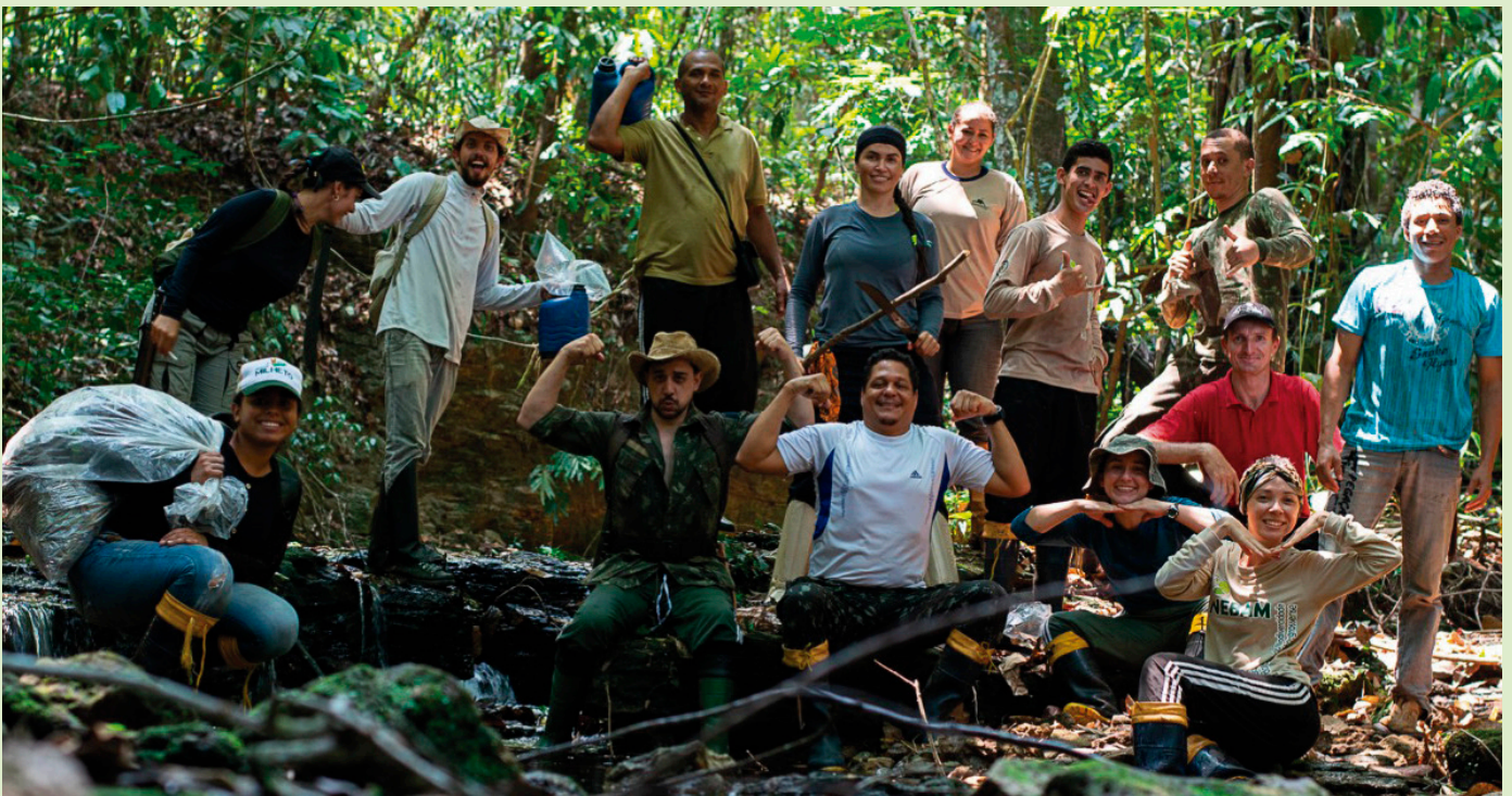
Equipe de pesquisadores, bolsistas e colaboradores do NR de Sinop.

Além da formação acadêmica, o núcleo promove cursos técnicos, treinamentos e ações educativas. Um museu itinerante da flora e fauna foi criado com material oriundo das atividades de campo e posteriormente depositado nas coleções científicas. O museu já visitou mais de 100 escolas públicas, alcançando mais de 80 mil crianças. Eventos científicos também integram essa trajetória, como o Simpósio da Amazônia Meridional em Ciências Ambientais, atualmente em sua oitava edição, que reúne pesquisadores de diversas regiões do país para debater temas como conservação, ordenamento territorial e bioprospecção no sul da Amazônia.