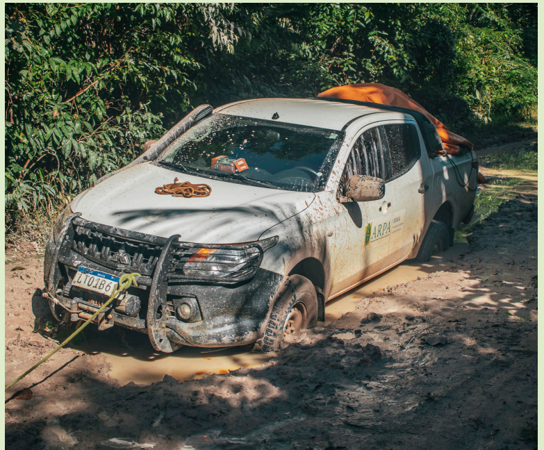
Os inúmeros desafios logísticos fazem com que o trabalho de campo seja complexo nas regiões meridionais da Amazônia.

Os módulos estão localizados em áreas estratégicas da Amazônia Meridional, incluindo regiões de floresta de transição Cerrado-Amazônia e áreas de floresta ombrófila. Esses ambientes representam mosaicos ecológicos fundamentais para compreender dinâmicas de biodiversidade em zonas de fronteira agrícola. Apesar da relevância científica, o trabalho de campo enfrenta desafios constantes. Em alguns sítios, a precariedade das estradas dificulta o acesso durante o período chuvoso; em outros, problemas como caça e invasão de terra nas proximidades, além da necessidade de manutenção das trilhas, exigem atenção permanente. Ainda assim, a infraestrutura logística, que inclui veículos para deslocamento, garante a continuidade das atividades e permite o monitoramento sistemático dos ecossistemas estudados.