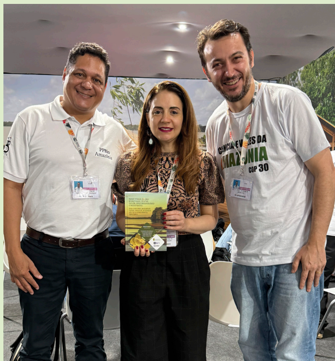
O Núcleo Regional de Sinop se destaca pela publicação de livros e participação em eventos de alta relevância ambiental como a COP30.

Em 2009, o Núcleo Regional de Sinop passou a integrar oficialmente a Rede PPBio Amazônia Ocidental, ampliando sua capacidade de atuação e consolidando novas parcerias institucionais. Entre elas, destacam-se as colaborações com o grupo Maracá, com o Office National des Forêts (ONF-Brasil) e com a Secretaria de Estado de Meio Ambiente de Mato Grosso, que viabilizaram a implantação de módulos de pesquisa em parques estaduais, estações ecológicas e áreas particulares destinadas à conservação da paisagem.