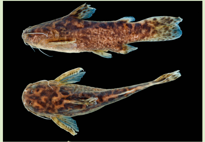
Centromochlus meridionalis é uma das espécies descritas por pesquisadores do NR de Sinop. Foto retirada do artigo publicado, disponível em https://doi.org/10.1590/S1679-62252013000400007 .

Inventários abrangentes têm registrado uma grande variedade de organismos, dos invertebrados aos vertebrados, demonstrando a elevada riqueza ecológica da região e reforçando a importância de sua conservação, especialmente na porção noroeste de Mato Grosso, onde se encontra o mosaico de unidades de conservação da Amazônia Meridional.