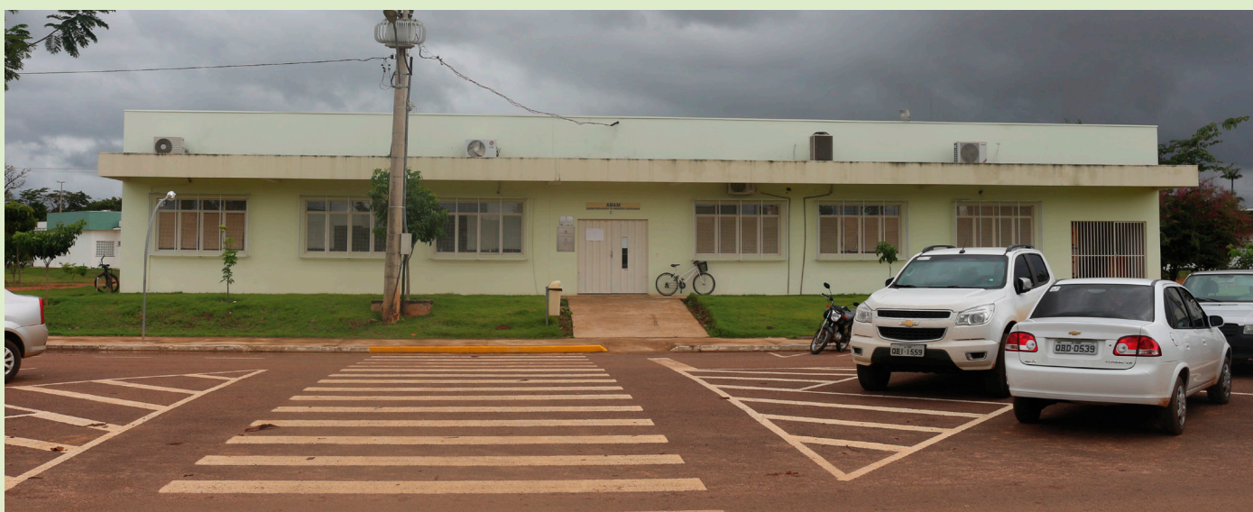
Sede do Acervo Biológico da Amazônia Meridional - ABAM, na Universidade Federal do Mato Grosso em Sinop.