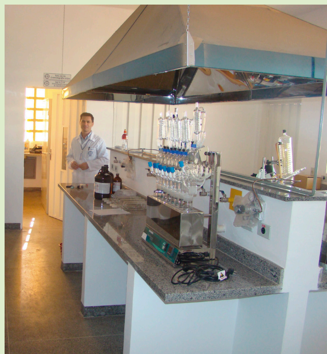
Laboratório utilizado pelas equipes do Núcleo Regional de Sinop em suas pesquisas.

Um dos pilares do Núcleo de Sinop é o fortalecimento de suas coleções científicas. Como prova disso, em 2012, foi institucionalizado o Acervo Biológico da Amazônia Meridional – ABAM que tem várias coleções apoiadas pelo PPBio como o herbário Centro-Norte-Mato-Grossense que reúne mais de 14 mil exsicatas cadastradas, e as coleções zoológicas (entomológica, Ictiológica, Aracnida não Insecta, herpetológica, ornitológica e mastozoológica, além da recente coleção de quirópteros). No câmpus de Cuiabá, há diversos pesquisadores do NR Sinop que coordenam laboratórios associados e coleções científicas, principalmente as de Coleoptera e Lepidoptera, as quais são referências para o estado de Mato Grosso. Essas coleções são fundamentais para documentar a biodiversidade regional e apoiar pesquisas futuras. Parte do material ainda passa por revisão taxonômica e processos de informatização, ampliando o acesso aos dados e integrando o núcleo a redes científicas nacionais, como o SIBBr, Rede de herbários do Brasil. O investimento em infraestrutura também se reflete na criação de novos laboratórios vinculados à pós-graduação em Ciências Ambientais. Esses espaços contribuem diretamente para as pesquisas temáticas do PPBio e envolvem anualmente dezenas de estudantes (iniciação científica, mestrado e doutorado) em atividades científicas nos sítios de Mato Grosso.