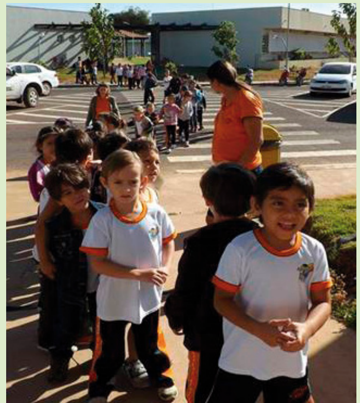
A presença e participação ativa do NR de Sinop do Mato Grosso reforça os princípios do PPBio AmOc de uma ciência mais inclusiva e acessível e integrativa para todos.

Mais do que produzir conhecimento, o Núcleo Regional de Sinop atua como um agente estratégico para o planejamento ambiental da Amazônia Meridional. Ao gerar dados confiáveis sobre espécies, habitats e impactos humanos, o núcleo contribui para políticas públicas, manejo sustentável e proteção da biodiversidade. Sua trajetória mostra que a pesquisa científica, quando aliada à formação de pessoas e à cooperação institucional, pode transformar regiões ainda pouco estudadas em referências para a ciência brasileira. Em um cenário global de mudanças ambientais, iniciativas como o Núcleo Regional de Sinop reforçam que conhecer é o primeiro passo para conservar, e que a Amazônia ainda guarda inúmeras histórias naturais à espera de serem reveladas.