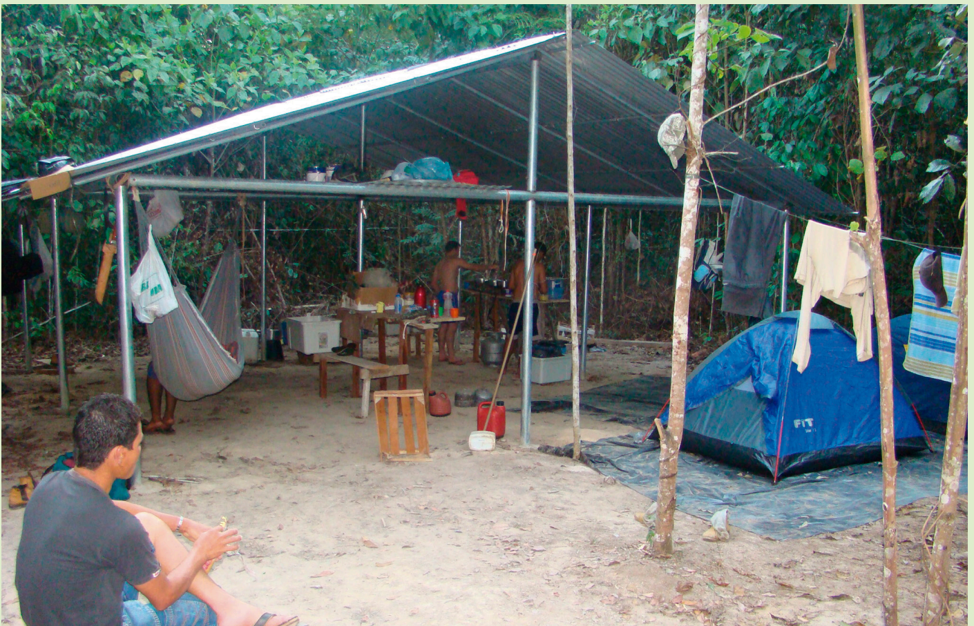
As condições de trabalho em campo são complexas e a logística de montagem dos acampamentos é custosa.