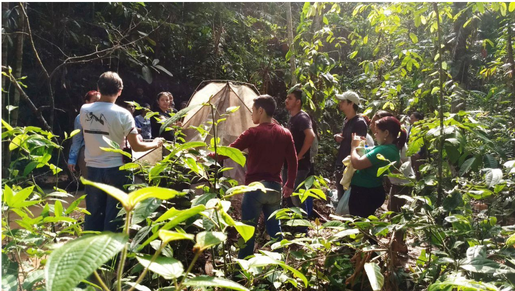
Explicação e montagem da armadilha "Malaise".