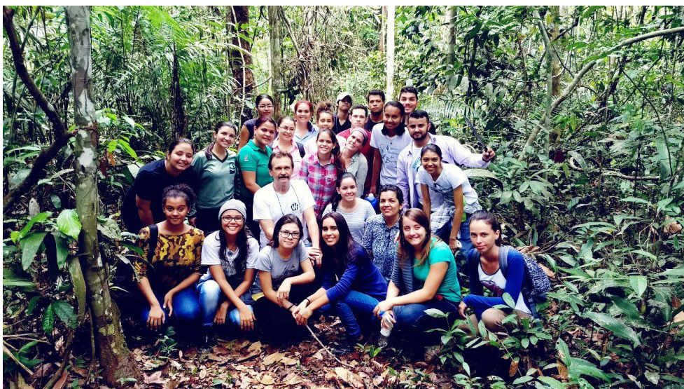
Alunos participantes do I Curso de Entomologia Básica em Rondônia.