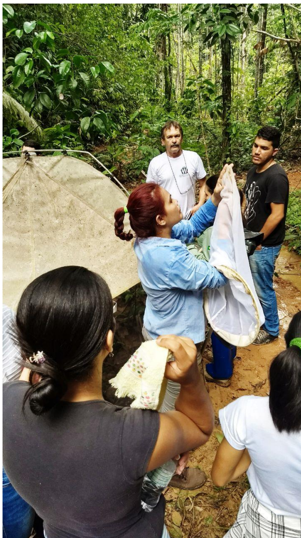
Armazenando material coletado com a rede entomológica.