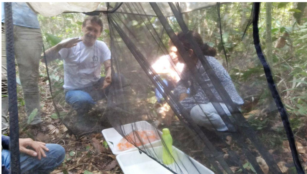
Explicação e montagem da armadilha "Malaise" complementada com bandejas.