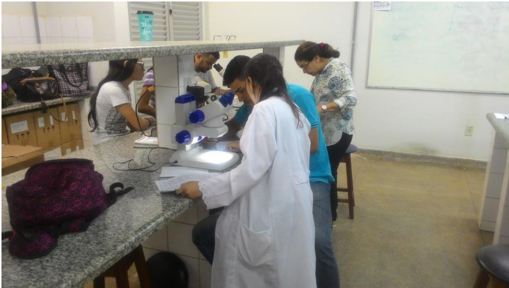
Alunos realizando a parte prática no laboratório, identificando as Ordens de insetos.