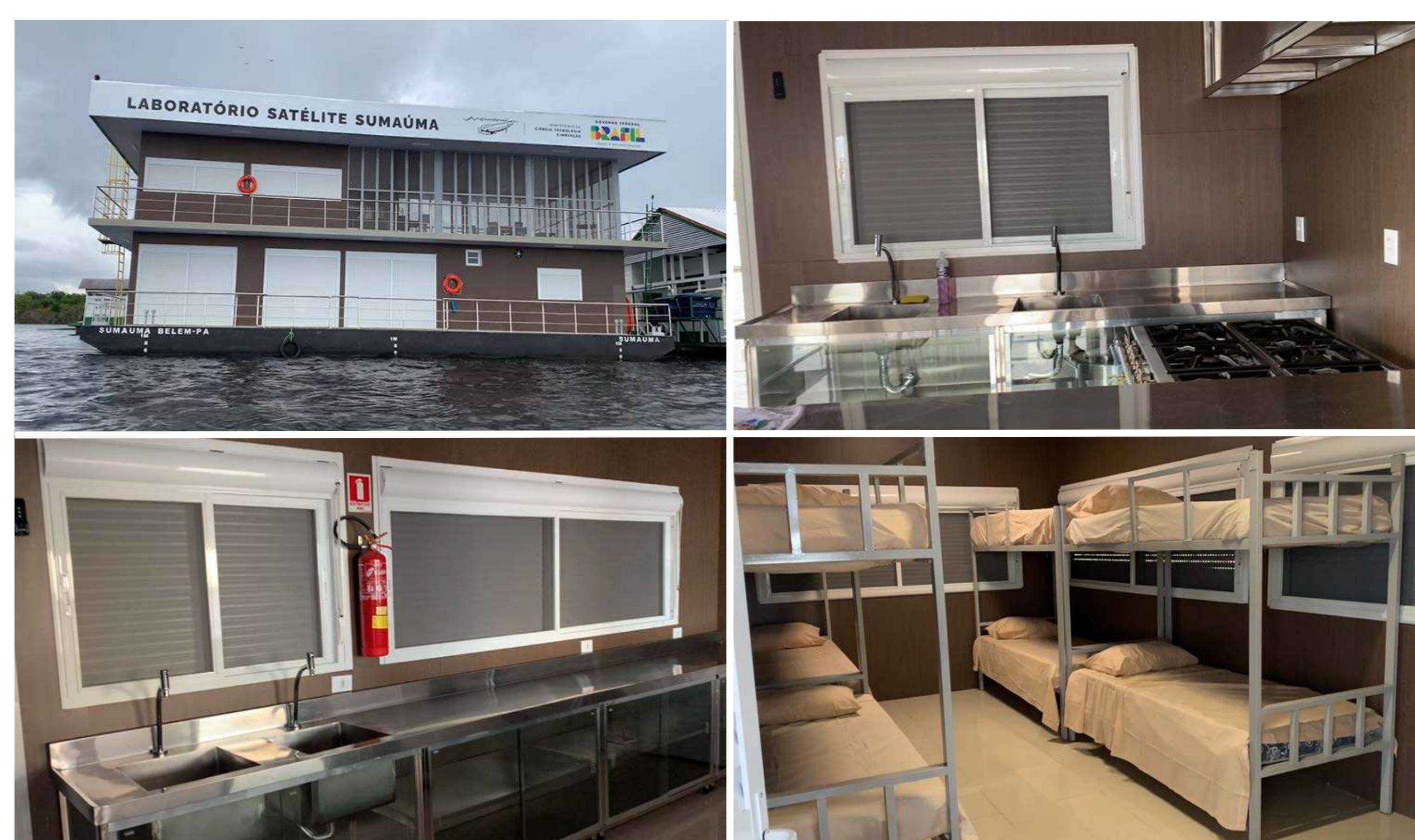
Figura 2. Infraestrutura da base SALAS Samaúma, na FLONA de Tefé.